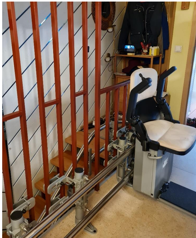
Sitz fährt an Schienensystem vom Keller bis ins Dachgeschoss.