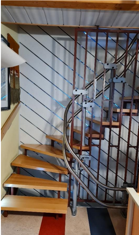
1) Enges Treppenfenster